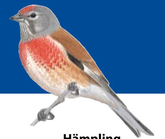
Hämling Carduelis cannabina