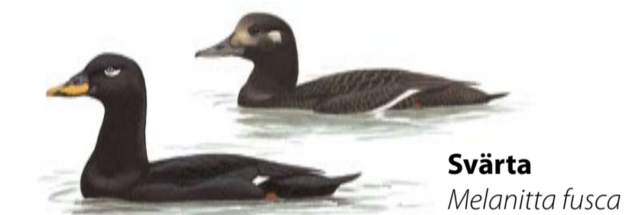
Svärta Melanitta fusca

Willkommen auf Järkö - einer der vielen Perlen unter den Ausflugszielen des inneren Schärengartens. Hier kann man über Felsgründe und Weideländer, oder durch die Laubwäldchen wandern und direkt von den Klippen aus ins Wasser springen. Der Mensch prägt seit Jahrhunderten die Landschaft auf Järkö. Dank des beschränkten Landbaus mit Ackern, Wiesen und Weiden ist eine offene Landschaft mit einem Kulturmilieu entstanden, das teilweise bis zum heutigen Tage erhalten geblieben ist. Die abwechslungsreiche Natur verfügt über eine reiche Pflanzen- und Tierwelt.