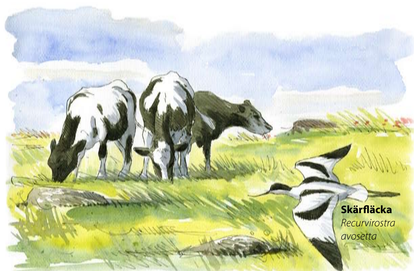
Skärfläcka Recurvirostra avosetta

Svartvit aristokrat. Även under sommaren är det full aktivitet när ett stort antal häckande fåglar söker föda i de långgrundna vikarna. Stiligast av dem alla är skärfläckan med distinkt svartvit dräkt och elegant uppåtböjd näbb.