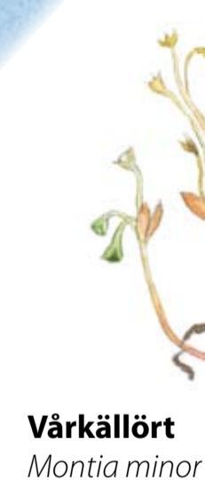
Vårkällört Montia minor