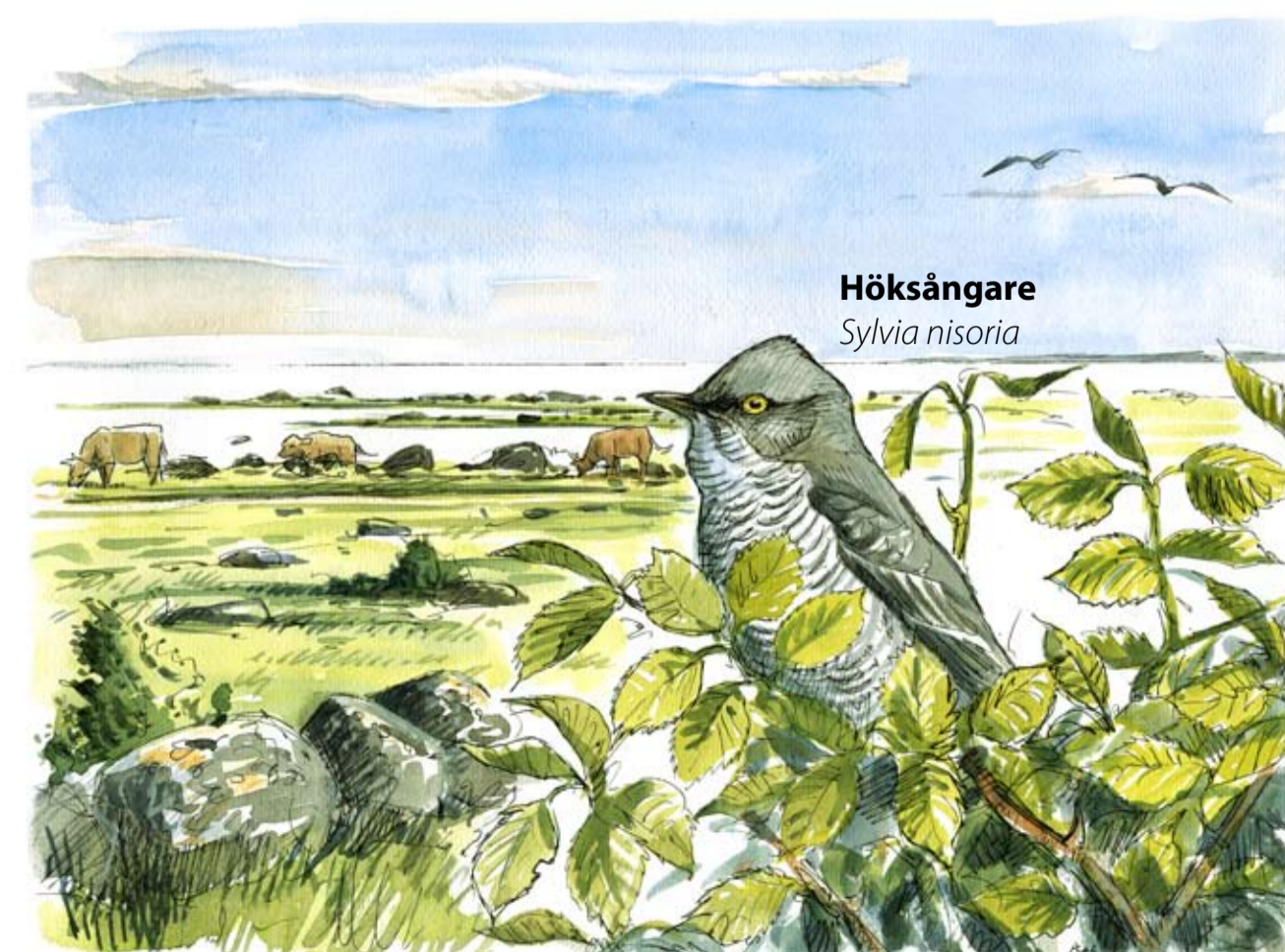
Höksångare Sylvia nisoria

🇬🇧 Welcome to Torhamns udde Nature Reserve – an Eldorado for birds in an historically valuable environment. Pasture land, moors and stony coastal meadows contribute to the area's distinctive landscape. Large areas are kept open through grazing, which benefits the rich flora. Large numbers of migratory birds fly over in spring and autumn, attracting a lot of visitors to the reserve. Particularly impressive is the eider flight in early April when on occasion hundreds of thousands of eider ducks can be seen. To a large extent the reserve consists of valuable marine areas that, among other things, are important as nursery grounds for fish.