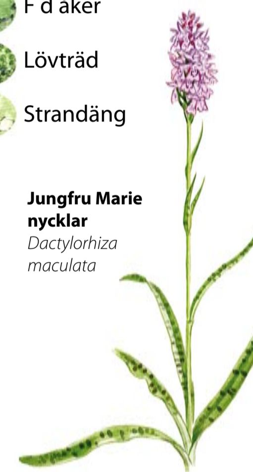
Jungfru Marie nycklar Dactylorhiza maculata